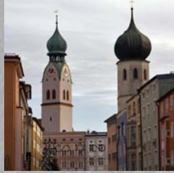
Rosenheim: 25 km