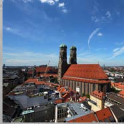
München: 75 km