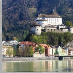
Kufstein (A): 30 km